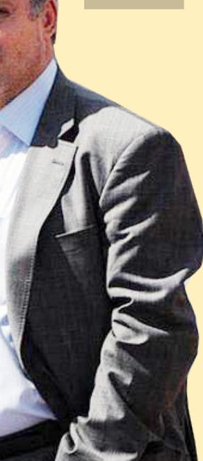
رئیس فدراسیون فوتبال،

رئیس فدراسیون فوتبال گفت: ذات فوتبال اما بسیاری از برنامه های تلویزیونی این امر را تبلیغ نمی کنند و این مقابله ها در برنامه های تلویزیونی سبب مخاطب گریزی می شود. مهدی تاج در نشست مجمع انتخاباتی هیئت فوتبال کهنگیلوبه و