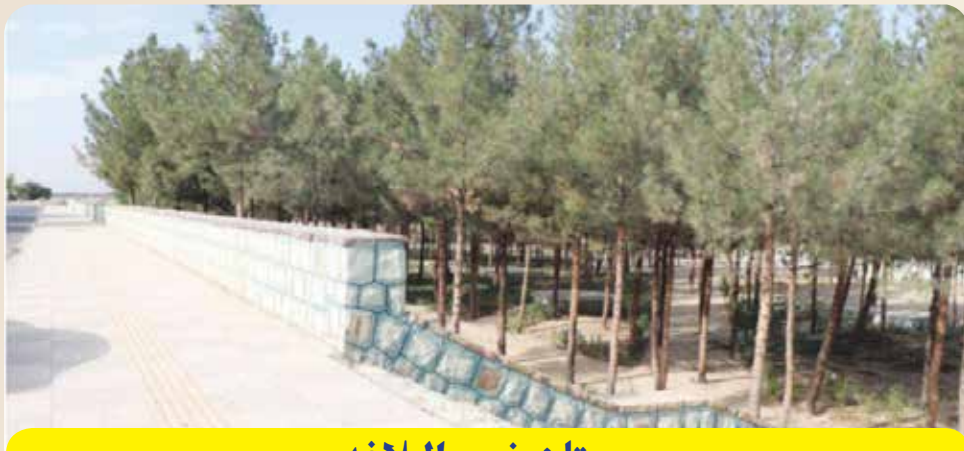
بوستان نهج البلاغه