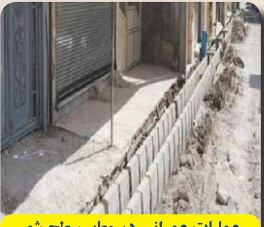
عملیات عمرانی در معابر سطح شهر