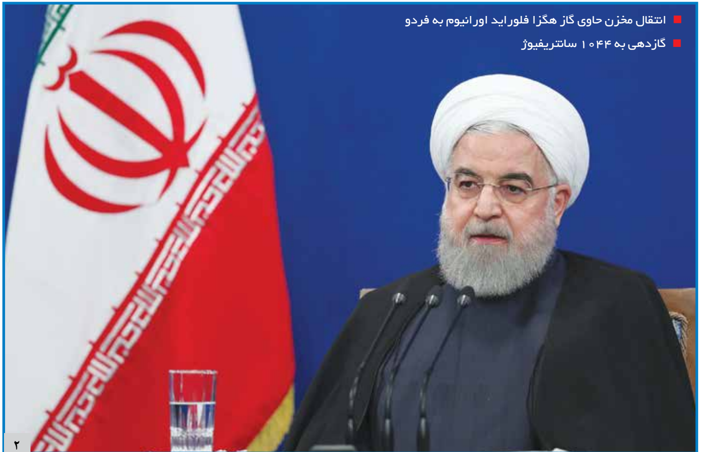
انتقال مخزن حاوی گاز مگزا فلوراید اورانیوم به فردو گازدهی به ۱۰۴۴ ساترینفیوژ