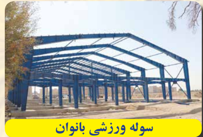
سوله ورزشی بانوان