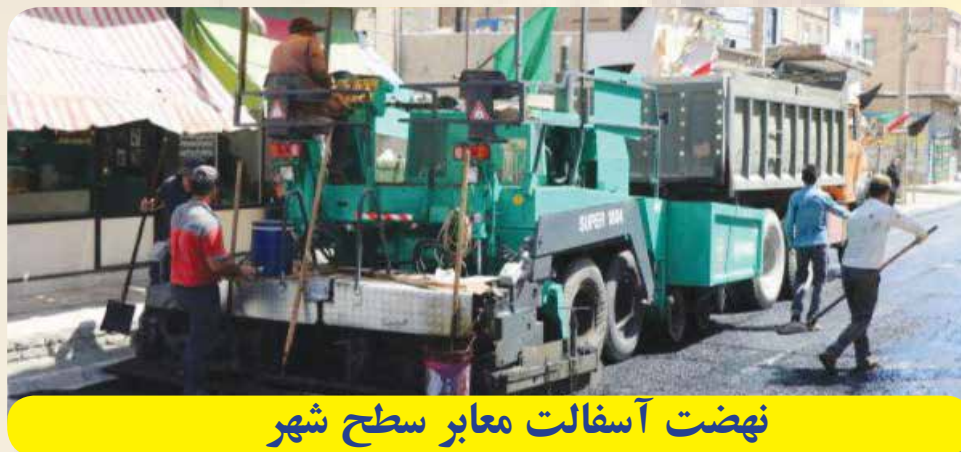
نهضت آسفالت معابر سطح شهر