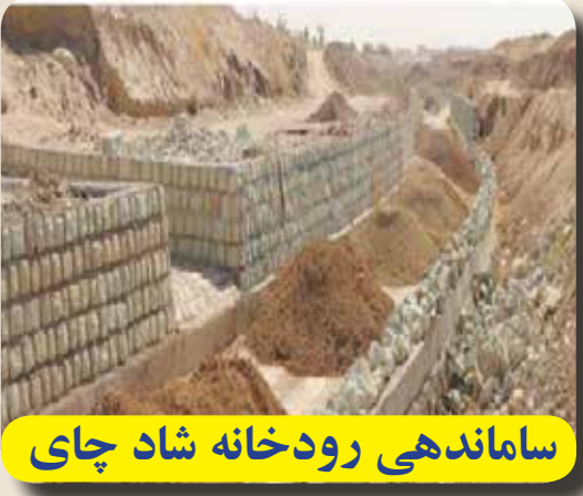
ساماندهی رودخانه شاد چای