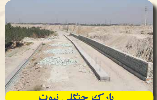
پارک جنگلی نبوت