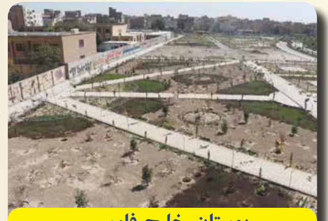
بوستان خلیج فارس