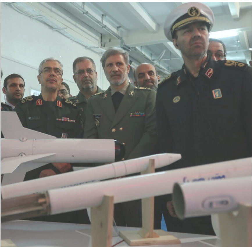
سرلشکر باقری در بازدید از نمایشگاه دستاوردهای دفاعی سازمان صنایع دفاع