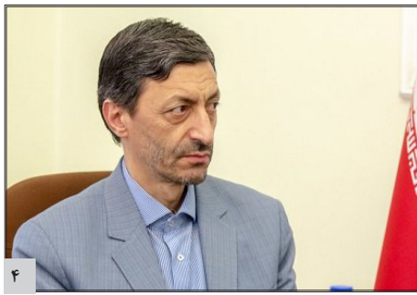
اختصاص ۳۸۰ میلیارد تومان از سوی بنیاد مستضعفان به مسکن معلولان