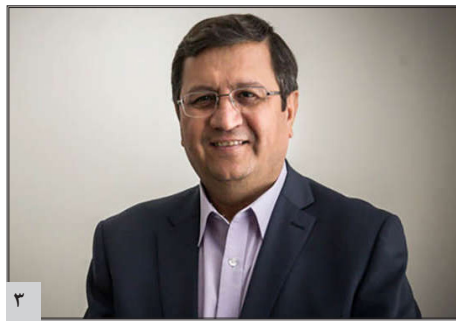
شوک قیمت بنزین ثبات بازار ارز را متاثر می کند