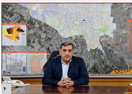
برای شهر به دنبال درآمدهای آسپب زانیم