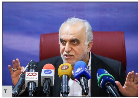
آزاد سازی سهام عدالت خون تازه‌ای به بازار سرمایه تزریق کرد