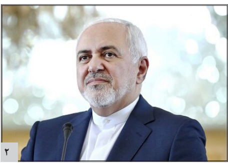
آمریکا بیشترین هزینه‌های نظامی را دارد اما نگران ایران است