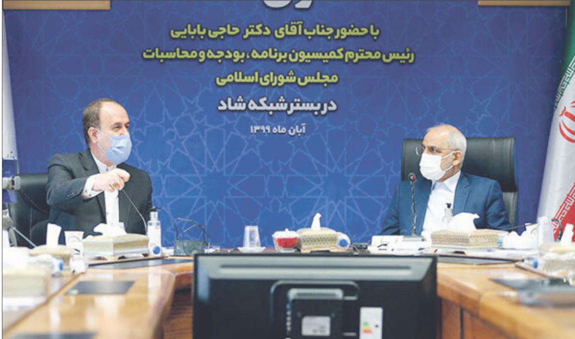
با حضور جناب آقای دکتر حاجی بابایی رئیس محترم کمیسیون برنامه، بودجه و محاسبات مجلس شورای اسلامی در بستر شبکه شاد آبان ماه ۱۳۹۹

رئیس کمیسیون برنامه، بودجه و محاسبات مجلس شورای اسلامی: