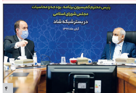
رئیس کمیسیون برنامه، بودجه و محاسبات مجلس شورای اسلامی: در بیشتر شبکه شاد باید تا دورترین نقاط کشور به دست دانش آموزان برسد