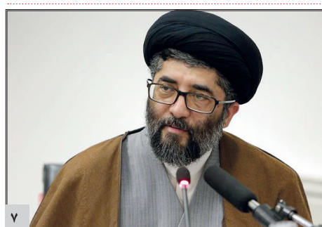
اهدای ۳۶ هزار جلد کتاب به مراکز فرهنگی و اجتماعی توسط آستان قدس رضوی