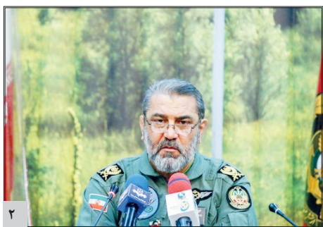
اعلام آمادگی ایران برای ساخت