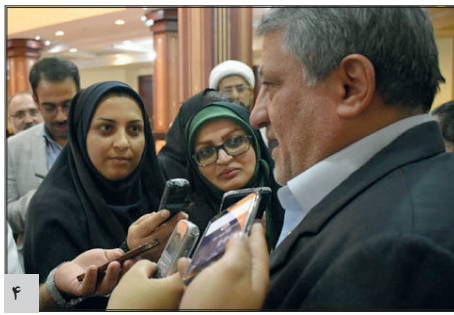
هاشمی: دولت هیچ حمایت جدی در حمل و نقل عمومی ندارد