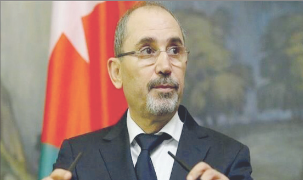
وزیر خارجه روسیه در ادامه یادآور شد: کشورهای غربی متحد واشنگتن نیز سیاست مشابهی را در قبال سوریه در پیش گرفته اند و در واقع، سیاست آنها در قبال دمشق، تکیه بر معیارهای دوگانه است.

وزیر خارجه اردن در سخنانی تأکید کرد که در حال حاضر هیچ استراتژی واضحی برای حل و فصل بحران سوریه دیده نمی شود. به نقل از العهد، «یمن الصفدی» وزیر خارجه اردن در سخنانی جدیدترین مواضع این کشور در قبال بحران سوریه را اعلام کرد. وی در این خصوص گفت: در حال حاضر هیچ استراتژی واضحی برای حل و فصل بحران سوریه دیده نمی‌شود. بر اساس این گزارش، وزیر خارجه اردن در ادامه گفت: حل و فصل بحران سوریه نیازمند مذاکرات سیاسی جدی است. بحران سوریه، راهکار نظامی ندارد و باید از طریق راهکار سیاسی حل و فصل شود.