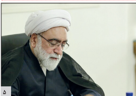
پیام تولیت آستان قدس رضوی به مناسبت ۱۶ آذر، روز دانشجو