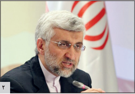
مقابل دوقطبی‌های موهوم