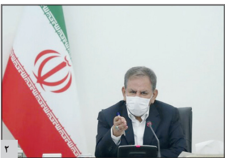
فرمانده کل ارتش گفت: در ضربه انتقام سخت، زمان، مکان و اندازه‌اش در اختیار ماست و کوچک‌ترین هدف ما در این ضربه انتقام، اخراج و بریدن پای آمریکایی‌ها از منطقه است ...