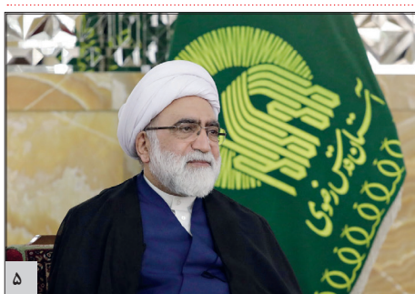
فرمانده کل ارتش گفت: در ضربه انتقام سخت، زمان، مکان و اندازه‌اش در اختیار ماست و کوچک‌ترین هدف ما در این ضربه انتقام، اخراج و بریدن پای آمریکایی‌ها از منطقه است ...