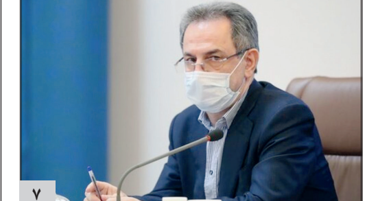
فرمانده کل ارتش گفت: در ضربه انتقام سخت، زمان، مکان و اندازه‌اش در اختیار ماست و کوچک‌ترین هدف ما در این ضربه انتقام، اخراج و بریدن پای آمریکایی‌ها از منطقه است ...