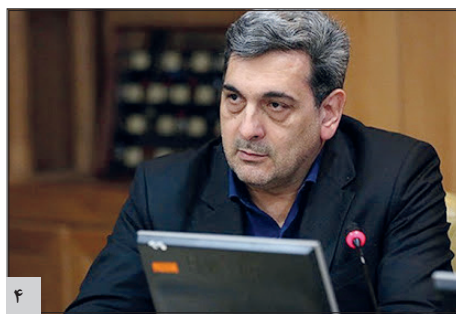
فرمانده کل ارتش گفت: در ضربه انتقام سخت، زمان، مکان و اندازه‌اش در اختیار ماست و کوچک‌ترین هدف ما در این ضربه انتقام، اخراج و بریدن پای آمریکایی‌ها از منطقه است ...