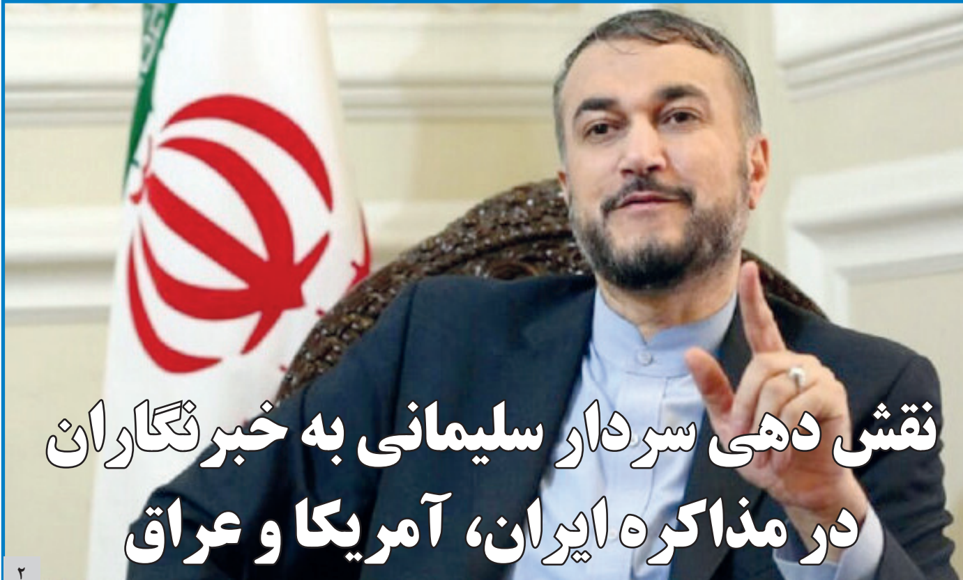
فرمانده کل ارتش گفت: در ضربه انتقام سخت، زمان، مکان و اندازه‌اش در اختیار ماست و کوچک‌ترین هدف ما در این ضربه انتقام، اخراج و بریدن پای آمریکایی‌ها از منطقه است ...