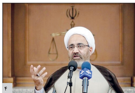
تخصیص گرایمی مهمترین راهبرد دیوان عدالت اداری در دوره تحول است

استان ها قائم مقام تولیت آستان قدس رضوی اعلام کرد: مشارکت آستان قدس با وزارت دفاع برای تولید واکسن «فخرا»