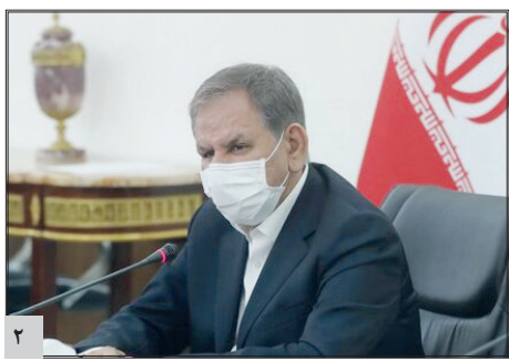
تشدید نظارت بر بازار برای جلوگیری از