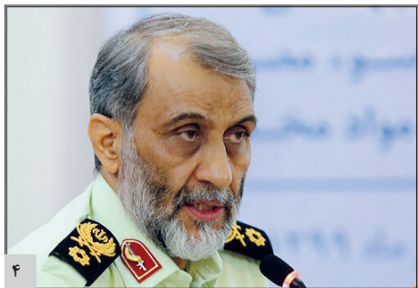
آمادگی کامل نیروی انتظامی برای برگزاری انتخابات