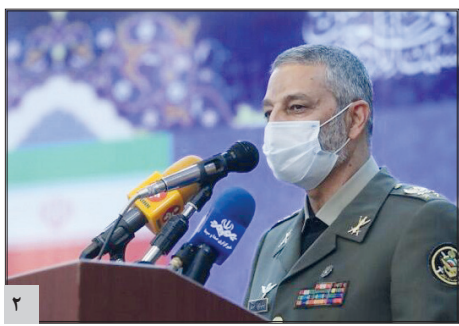
فرمانده ارتش: اجرای بیانیه کام دوم انقلاب اصلی ترین هدف ارتش است