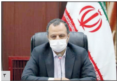
وزیر اقتصاد: اقتصاد ایران در نبود مدیریت هوشمند رها شده است