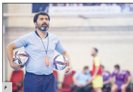
ناظم الشریعه: ملی پوشان فوتبال به حمایت و روحیه نیاز دارند