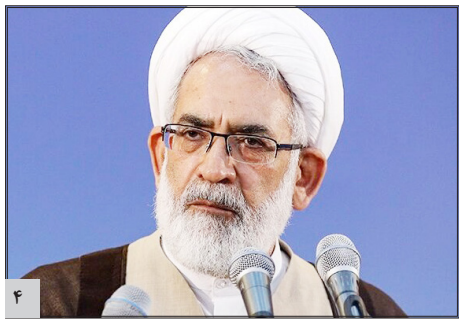
دستگاه های اطلاعاتی و امنیتی ریشه های قاچاق را در کشور شناسایی کنند