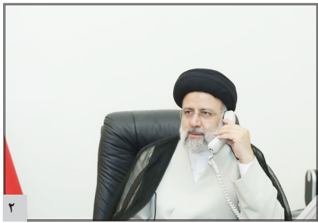
رئیس جمهور: توسعه سطح همکاری های اقتصادی تهران و ایروان، امنیت ساز است