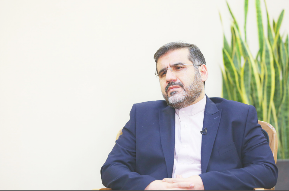
وزیر فرهنگ و ارشاد اسلامی

وزیر فرهنگ و ارشاد اسلامی با اشاره به اینکه منطقه ما سال‌هاست که محل تولد و رشد پیامبران و پیروان آنهاست، گفت: دشمن تلاش داشت بین ادیان تفرقه بیناندازد که حاج قاسم برای از بین بردن این توطئه وارد میدان شد و چهره واقعی حامیان این توطئه‌ها را افشا و محاصره رسانه‌ای آنها را بر هم زد.محمدمهدی اسماعیلی روز دوشنبه در همایش بزرگداشت دومین سالگرد شهادت سردار حاج قاسم سلیمانی که در سازمان فرهنگ و ارتباطات اسلامی برگزار شد، با اشاره به ابعاد وجودی و ویژگیهای شخصیتی سردار شهید دلپا سپهبد حاج قاسم سلیمانی، گفت: امروز سالروز شهادت مرد بزرگی است که در طول چند سال اخیر به خصوص از سال ۲۰۱۱ با توجه به اتفاقاتی که در منطقه رخ داد به عنوان یک قهرمان ملی و منطقه‌ای مورد تکریم همگان از جمله مسلمانان و پیروان ادیان مختلف است.