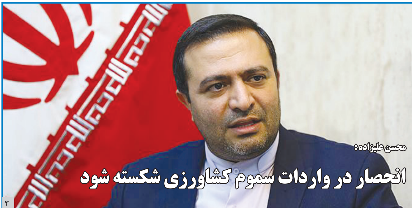
انحصار در واردات سموم کشاورزی شکسته شود