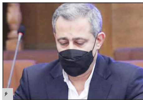
بودجه‌ای بیشتر از مصوب در اختیار فدراسیون‌های ورزشی قرار دادیم