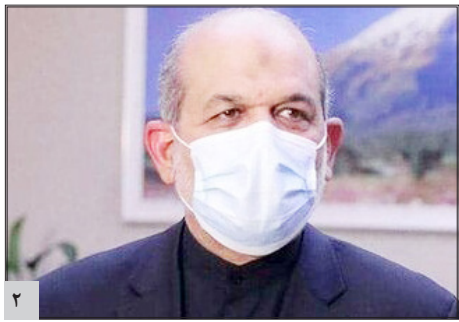
وزیر کشور: مسئولان تا حل مشکلات سیلزدگان کنار آنها خواهند ماند