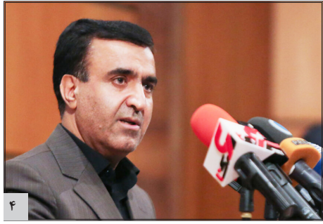
سلاجقه: ورود دولت به کاهش آلودگی هوا، عملیاتی است