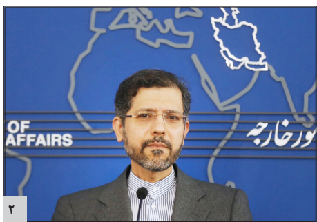
خطیب زاده: مذاکرات پیشرفت خوبی داشته است