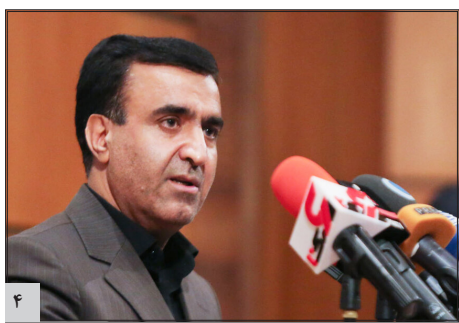
چالش‌های رودخانه‌ها فشار تحمل ناپذیری بر منابع آب وارد کرده است