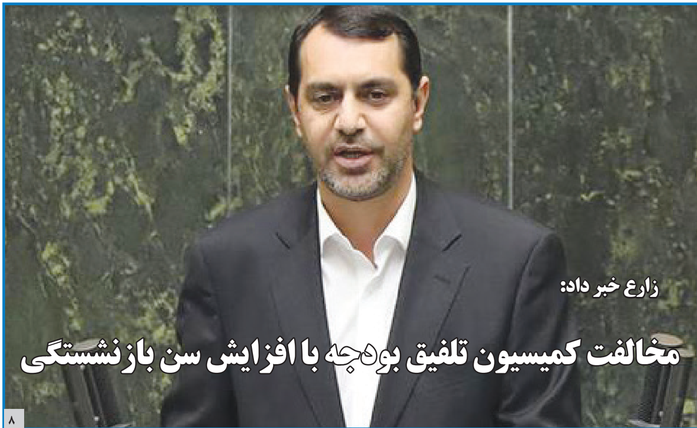
زارع خبر داد:

مخالفت کمیسیون تلفیق بودجه با افزایش سن بازنشستگی