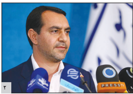
سخنگوی کمیسیون تلفیق بودجه مطرح کرد:

اختصاص ۲ میلیارد دلار برای ساخت خطوط مترو و خرید اتوبوس