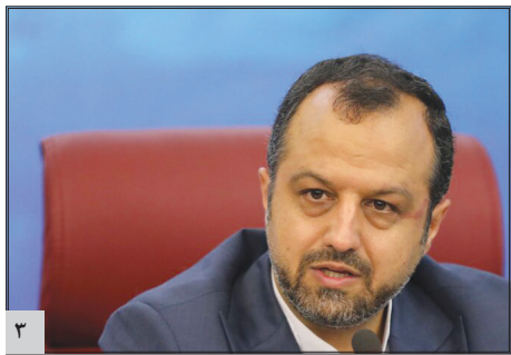
وزیر اقتصاد تاکید کرد:

اختصاص ۲ میلیارد دلار برای ساخت خطوط مترو و خرید اتوبوس