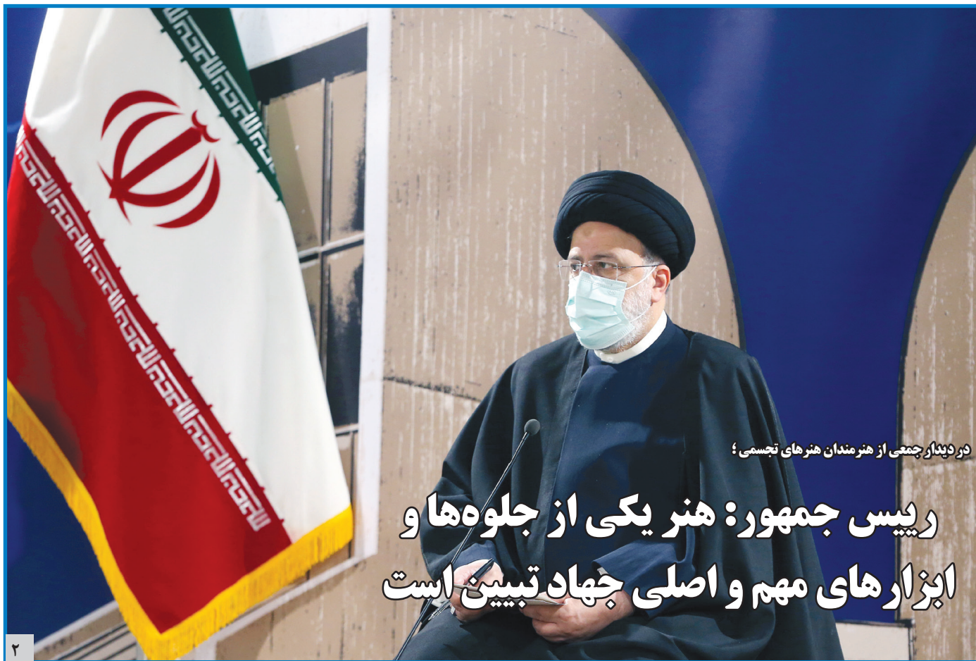
در دیدار جمعی از هنرمندان هنرهای تجسمی؛

رئیس جمهور: هنریکی از جلوه‌ها و ابزارهای مهم و اصلی جهاد تبیین است