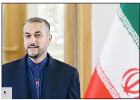
امیر عبداللهیان: به دنبال توافق موقت و محدود نیستیم