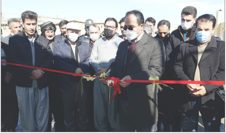
وی افزود: همچنین چهار هزار و پانصد و پنجاه و چهارمین واحد مقاوم سازی شده مسکن روستایی افتتاح و هفت هزار و سی و ششمین جلد سند مالکیت تحویل شد.

اعتبار ۲۰ میلیارد ریال از جمله طرح های بودند که امروز بطور نمادین در روستایی علی اباد یاپل به بهره برداری رسیدند.