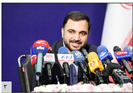
وزیر ارتباطات و فناوری اطلاعات مطرح کرد: عدم توسعه زیرساخت‌ها، دلیل اصلی کندی اینترنت