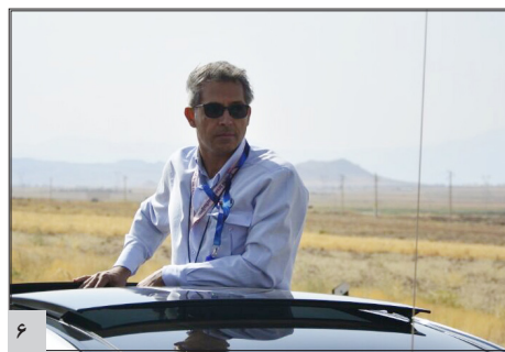
ناصری: متاسفانه تنها داور بین‌المللی دوچرخه سواری هشتم