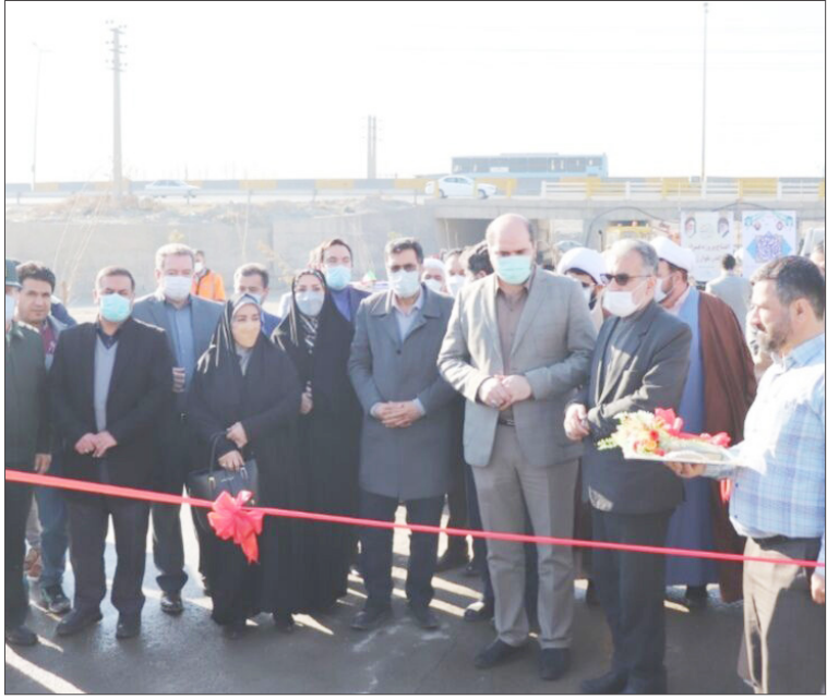
استاندار تهران از تخصیص بیش از ۲۲ هزار میلیارد تومان به پروژه های قابل افتتاح در تهران خبر داد.

محسن منصوری در آیین افتتاح پروژه های دهه فجر شهرستان قدس گفت: به برکت گرمیاداشت چهل و سومین سالروز پیروزی انقلاب اسلامی، امسال شاهد افتتاح پروژه های متعدد و متنوعی در حوزه های مختلف اقتصادی و عمرانی بودیم که حدود ۱۲ هزار میلیارد تومان آن مربوط به پروژه های اقتصادی و حدود ۱۰ هزار میلیارد تومان دیگر برای پروژه های عمرانی است.