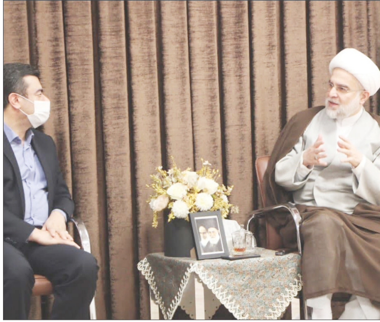
نماینده ولی فقیه در کردستان گفت: طرحی برای ساماندهی کارگران فصلی که بخشی از برآورد بودجه دولت است، برنامه‌ریزی و اجرا شود.

حجت‌الاسلام و المسلمین عبدالرضا پورذهبی در دیدار مدیران و معاونان اداره کل تعاون، کار و رفاه اجتماعی استان کردستان به بازدید اخیر خود از کارگاه‌ها و واحدهای تولیدی مرکز استان کردستان و تنگناهایی که فعالان این عرصه داشتند، اشاره و بر ضرورت احقاق حق کارگران تاکید کرد.