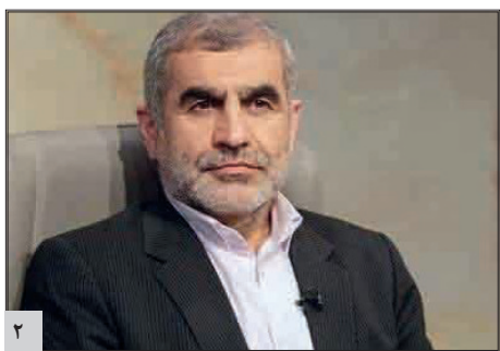
نائب رئیس مجلس: افزایش کلابه ها از گرانی/نگران وضع موجود اقتصادی مردم هستیم