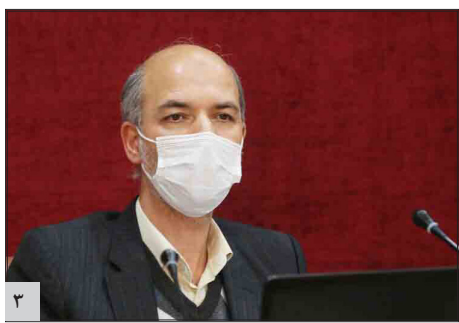
وزیر نیرو: بحران آب در هزاره سوم چالش اصلی دنیا است