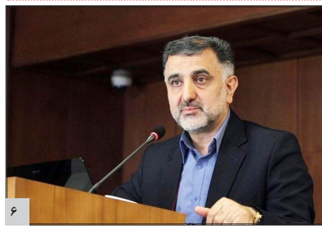
فدراسیون ورزش‌های زورخانه‌ای با حمایت دولت امسال به خوبی تامین اعتبار شد