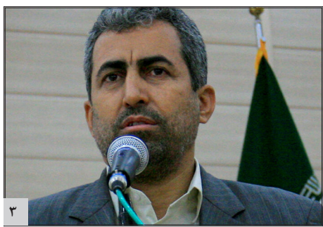
کشورهای اطراف از سرمایه‌گذاری در مناطق آزاد جدید استقبال می‌کنند