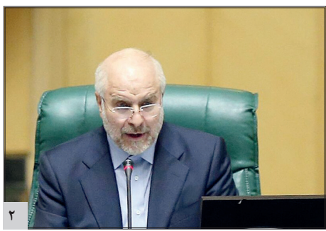
قالیاف: حقوق مدیران در پاکنا ثبت