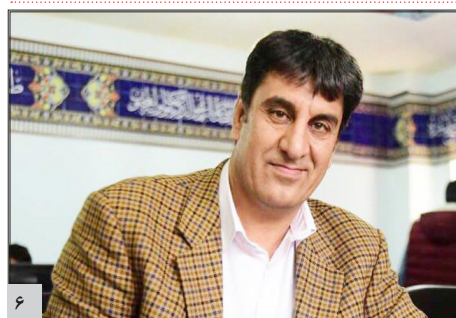
افشاریان: فدراسیون فوتبال