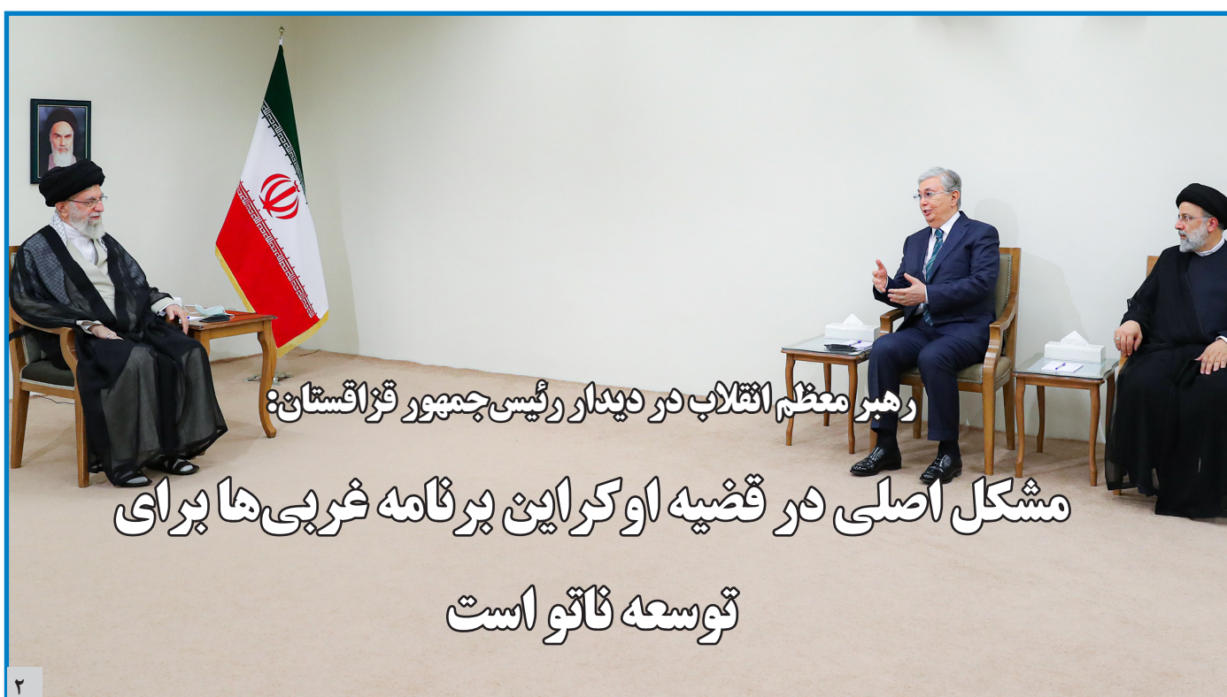
رهبر معظم انقلاب در دیدار رئیس جمهور تراز استانبول

مشکل اصلی در قضیه اوکراین پرنامه غربی ها برای