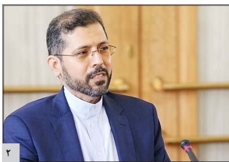
خطیب زاده در نشست خبری: مذاکرات