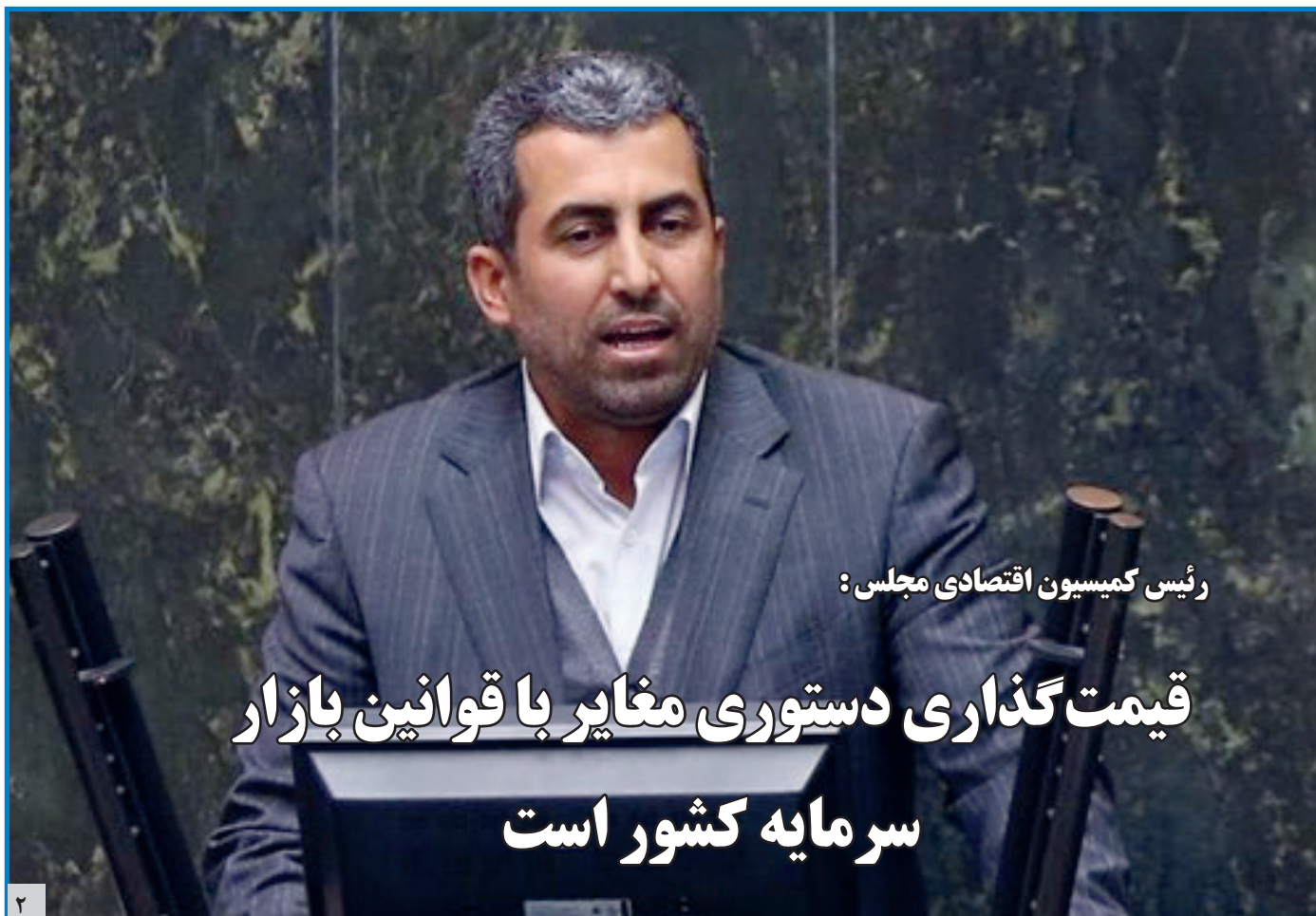
رئیس کمیسیون اقتصادی مجلس:

قیمت گذاری دستوری مغایر با قوانین بازار سرمایه کشور است