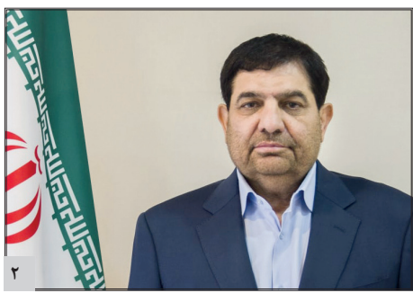
در آیین رونمایی پلنت پایلوت ساخت گاز هلیوم و LNG

مخبر بر نقش مهم شرکت‌های دانش بنیان در رفع چالش‌های فناوری کشور تاکید کرد