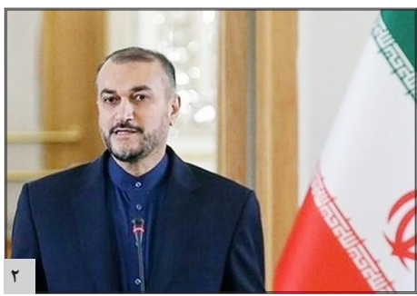
امیر عبدالکلیان: محدودیتی در توسعه روابط ایران و تونس وجود ندارد