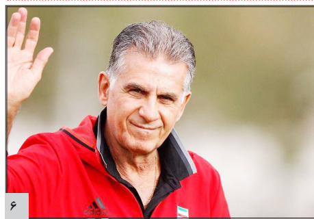
کی‌روش: بازگشتم تا خاطرهای خوش به یادگار بگذارم