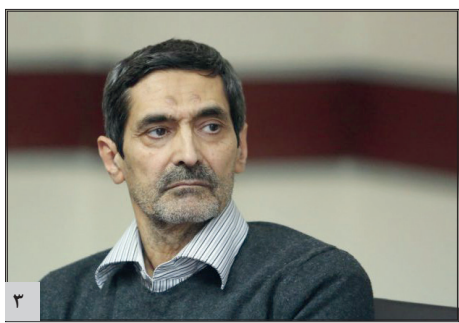
عوامل گرانی خودرو در کشور / انتقادات مشتریان به محصولات خودرویی وارد است