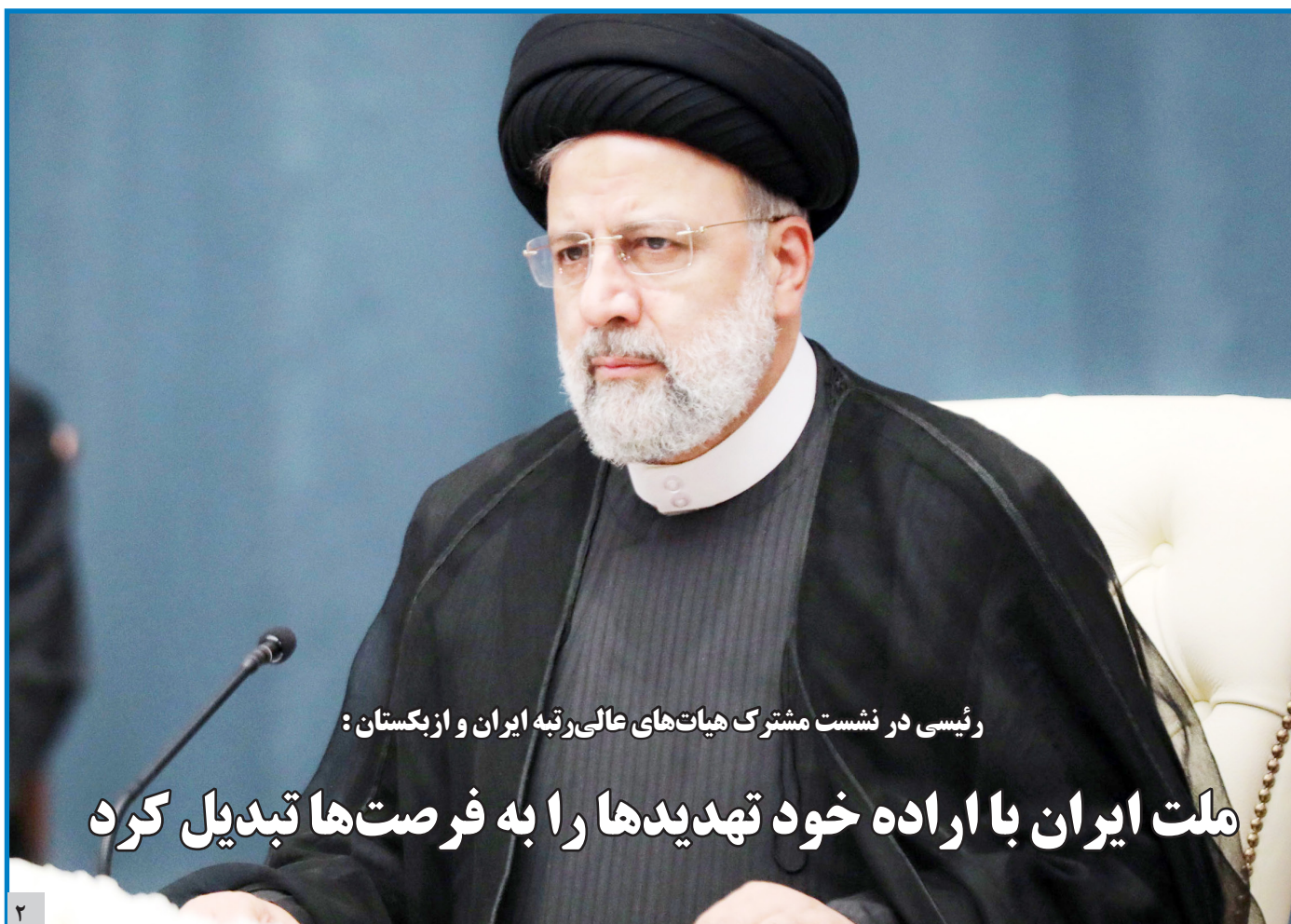
رئیس در نشست مشترک هیات‌های عالی‌رتبه ایران و ازبکستان: