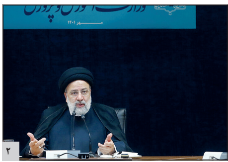
پیشنهاد رئیس‌جمهور به متولیان تعلیم و تربیت:

آیت‌الله رئیسی: «راهیان پیشرفت» در آموزش و پرورش راه‌اندازی شود