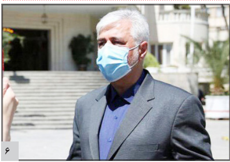
وزیر ورزش و جوانان: به نتایج در جام جهانی ۲۰۲۲ امیدوارم