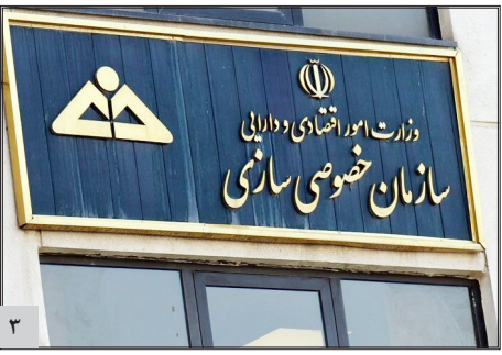
واگذاری سهام خودروسازان در اولویت سازمان خصوصی سازی