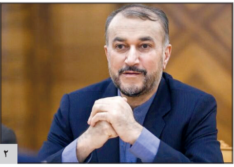
امیر عبداللہیان: آقای بایدن! رفتار ریاکارانه را متوقف کنید