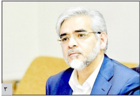
رئیس سازمان خصوصی سازی: سود سهام عدالت دو برابر می شود