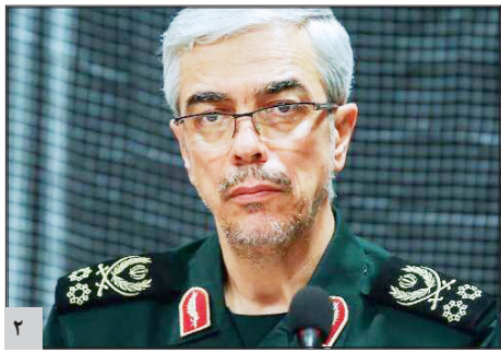
سر لشکر باقری: اتکا به توان داخلی، استقلال واقعی کشور را به ارمان می آورد