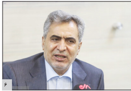
رئیس سازمان نظام پرستاری مطرح کرد؛ ماجرای تقسیم بودجه کارانه پرستاری