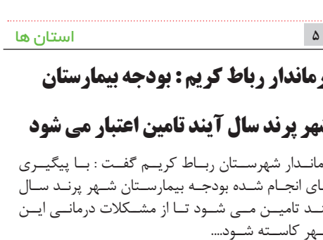
فرماندار رباط کریم: بودجه بیمارستان شهر برند سال آیند تامین می شود