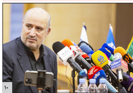
تاج: فصل آینده لیگ برتر با VAR برگزار خواهد شد