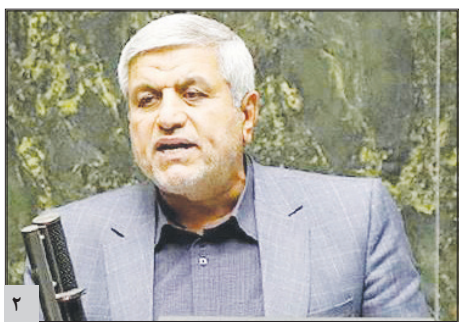
بیکاری جوانان از یک مقوله اجتماعی