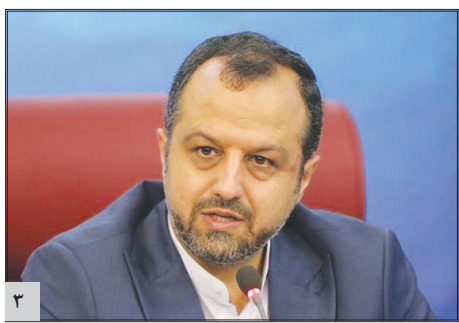
حداقل حقوق کارمندان در سال آینده ۷ میلیون تومان