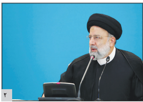
رئیس جمهور: ساخت ۲۳ هزار مسکن توسط کمیته امداد از جلوه‌های ارزشمند این نهاد است