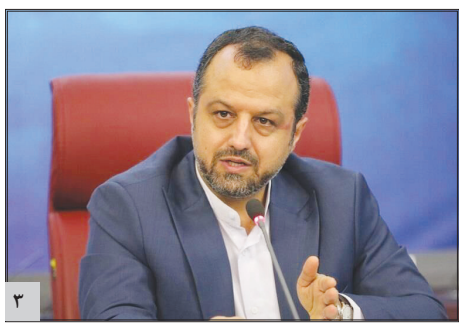
وزیر اقتصاد: نرخ تورم سال آینده کمتر از امسال خواهد بود