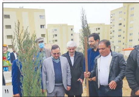
فرماندار رباط کریم: ۶ هکتار جنگل کاری در شهر پرند اجرا شده است