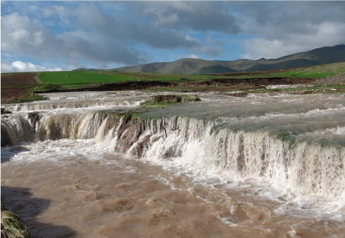
آبشار آبشار کوه سار در استان کرمانشاه