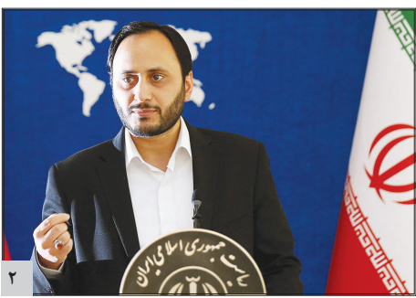
جمهوری: نخبگان داری ایران هستند /

سه شنبه ۱۵ اسفند ۱۴۰۲ ♦ سال ششم ♦ شماره ۲۲۷ ♦ ۱۰۰۰۰ تومان ♦ هفته نامه اجتماعی - فرهنگی - اقتصادی